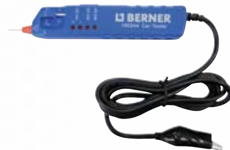
Tester napięcia 6 - 48 V DC Nr art. 185244