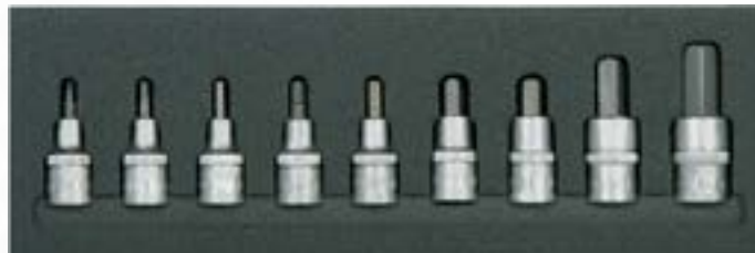
Wkład z kompletem nasadek trzpieniowych 6-kątnych, 1/2"