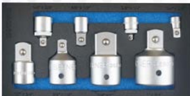
Zestaw nasadek redukcyjnych i powiększających - 8 elementów