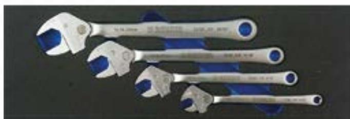
Wkład z kompletem kluczy płaskich z grzechotką