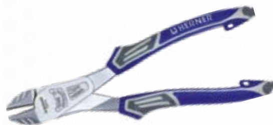
Szczypce tnące boczne 3K wzmacniane, 180 mm Nr art. 100518