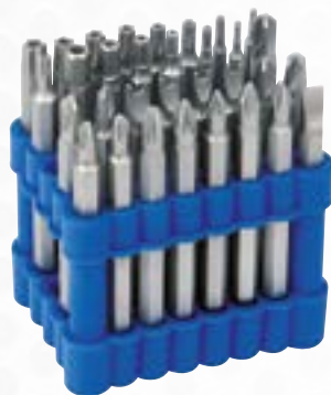
Bity Clever 1/4" zestaw: 32 sztuki Nr art. 165750