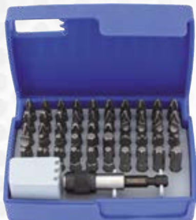
Zestaw bitów uniwersalnych 1/4" 51 elementów Nr art. 156540