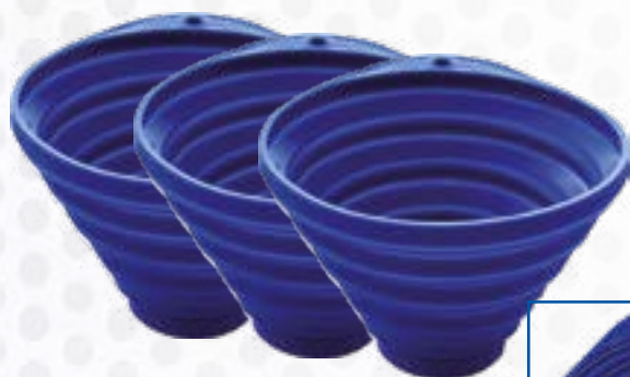
Elastyczna miska magnetyczna, 3 sztuki Nr art. 129286