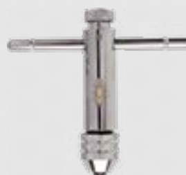
Grzechotka do gwintowników DIN 377 Nr art. 228249