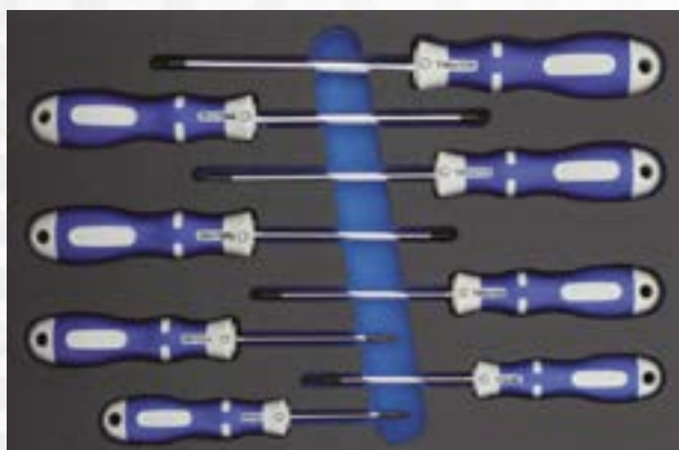
Wkrętaki 2K Top zestaw TX, pianka