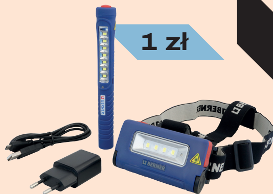
Zestaw Lampa czołowa + Penlight LED