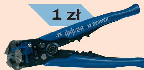
Szczypce do usuwania izolacji, 661