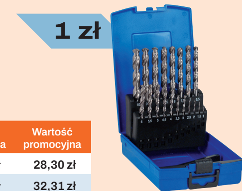
Wiertła DIN 338 srebrne TOP