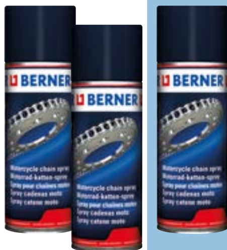
Smar do łańcuchów motocyklowych, 400 ml