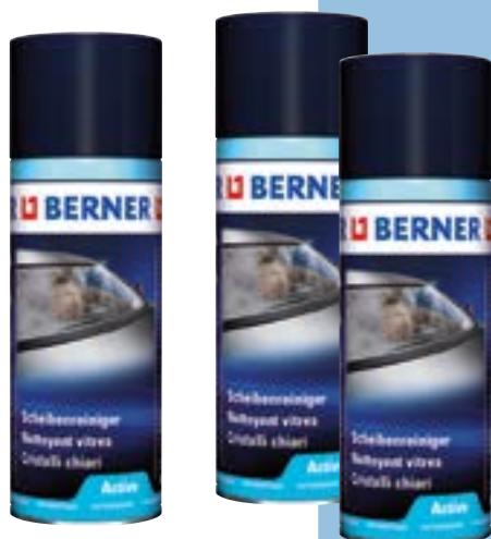
Środek do czyszczenia szyb, 400 ml