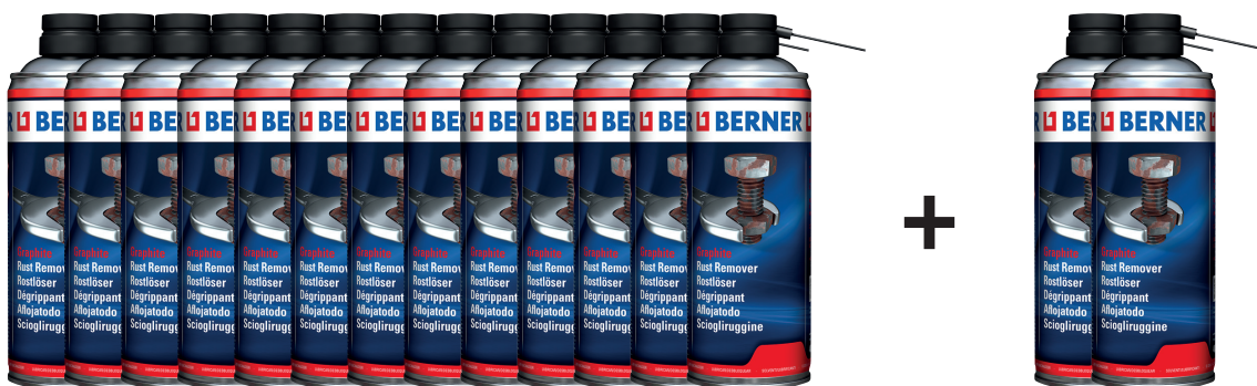
Odrdzewiacz grafitowy, 400 ml

Kup 13 szt. odrdzewiacza grafitowego w cenie 24,90 zł/szt., a dwa kolejne otrzymasz w cenie: 1 zł/szt!