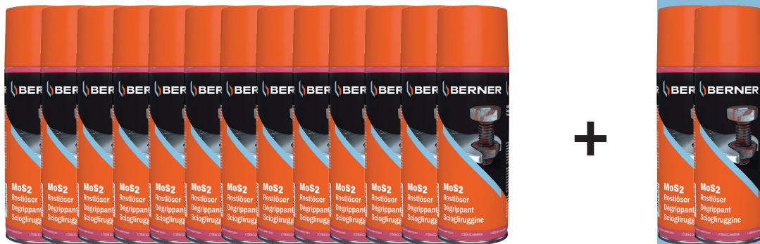
Odrdzewiacz MoS 2 , 400 ml

Kup 13 szt. odrdzewiacza MoS 2 w cenie 14,90 zł/szt., a dwa kolejne otrzymasz w cenie: 1 zł/szt!