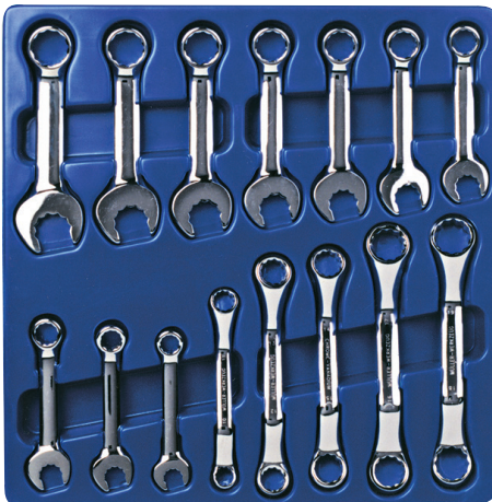
Klucze płasko-oczkowe, dwustronne, TG, 15 elem.