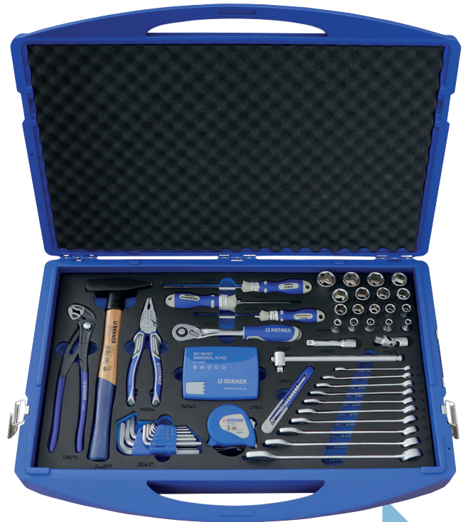
Komplet narzędzi uniwersalnych 37 el., wkład, Box