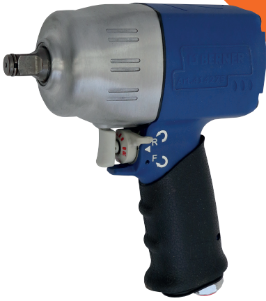
Klucz udarowy 1/2" BPT-IW hybrydowy, 7500 r/min, 1850 N/m